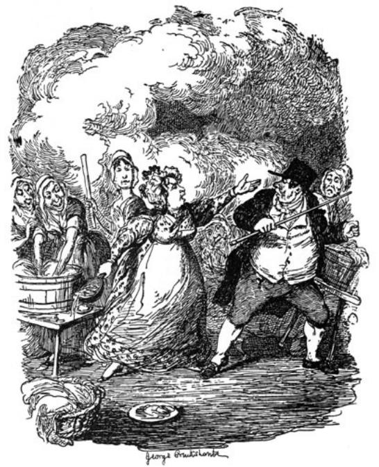
Figure 4 救貧院院長バンブル