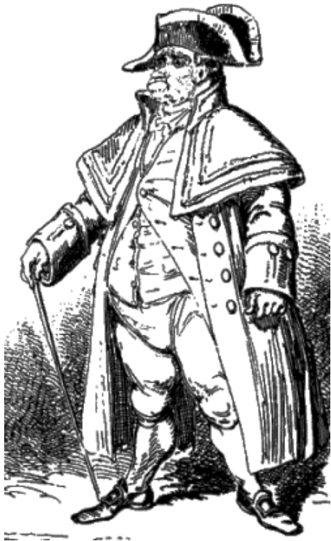
Figure 1 Parish Beadle (Cruikshank 1827)