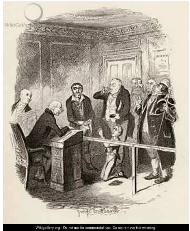
Figure 2 教区吏バンブル (1 番右)